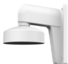
DS-1272ZJ-110 Настенный кронштейн