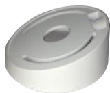
DS-1259ZJ Потолочное крепление