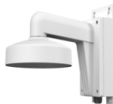
DS-1272ZJ-110B Настенный кронштейн