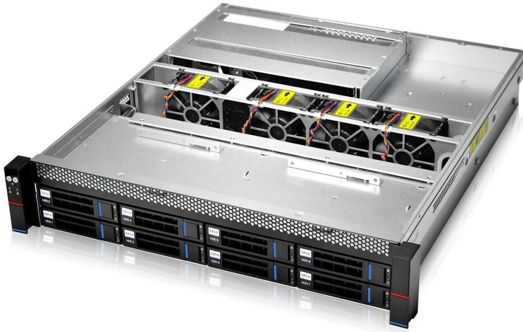
Рисунок 2. Серверная платформа QSRV-230804 (вид сверху)