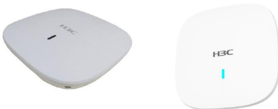
НЗС WA6320, точка доступа 802.11ax/ac/n с двумя радиомодулями, 4 потока, встроенные антенны

Точки доступа серии WA6320 от НЗС представляют собой новейшее поколение точек беспроводного доступа, созданных на основе стандарта 802.11ax. Они создавались с использованием инновационной технологии 802.11ax, обладают двумя радиомодулями и обеспечивают скорость передачи как минимум в 2 раза выше по сравнению с продуктами стандарта 802.11ac. Благодаря этому устройства серии подходят для организации беспроводной сети в условиях высокой плотности пользователей, таких как гостиницы, предприятия розничной торговли и интеллектуальные корпоративные группы зданий. Устройства выполнены в компактном корпусе и могут крепиться на стену и монтироваться на потолок.