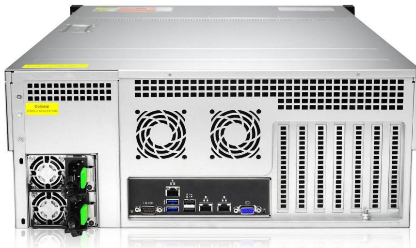
Рисунок 1. Серверная платформа QSRV-VS-462402RMC (Вид сзади)